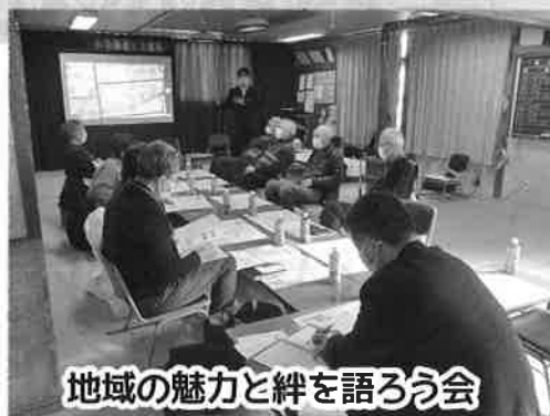
地域の魅力と絆を語ろう会

また、市民の皆さまと一緒に、身近な支えあいづくりを行うための『地域の魅力と絆を語ろう会』の開催や、新規サロンを立ち上げるための取り組みなどを行っています。