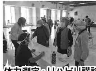
体力測定・リハビリ講話

受付のほか、運動やレクを参加者と一緒に楽しんでもくれる ボランティア を募集しています！詳しくは、社会福祉協議会までご連絡ください！