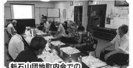
新石山団地町内会での地域の魅力と絆を語ろう会の様子

また、市民の皆さまと一緒に、身近な支えあいづくりを行うための『地域の魅力と絆を語ろう会』の開催や、新規サロンを立ち上げるための取り組みなどを行っています。