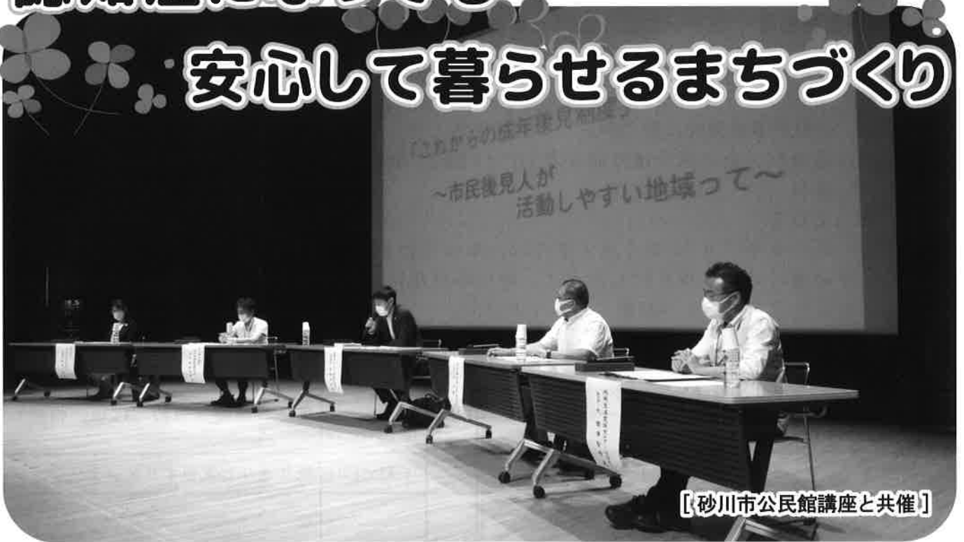
[砂川市公民館講座と共催]