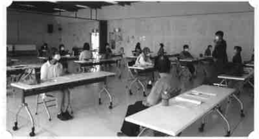
『健康寿命ささえ愛』講座

※ 新型コロナウイルス感染状況に応じ、開催内容の変更や中止とする場合がございますので、あらかじめご了承ください