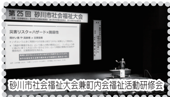
砂川市社会福祉大会兼町内会福祉活動研修会