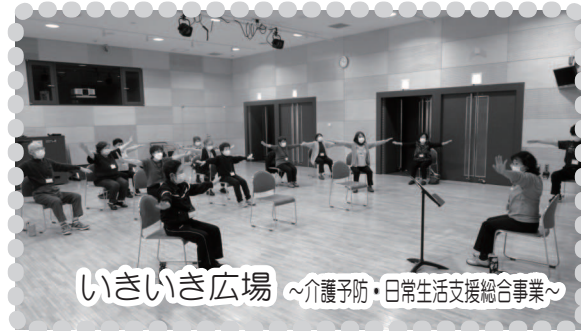
いきいき広場 ～介護予防・日常生活支援総合事業～