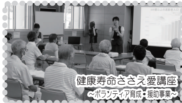
健康寿命ささえ愛講座 ～ボランティア育成・援助事業～