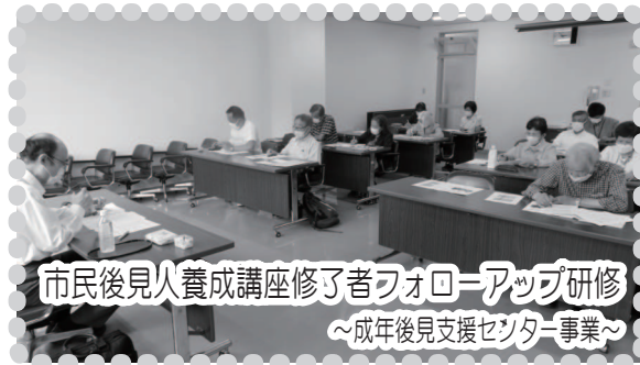
市民後見人養成講座修了者フォローアップ研修 ～成年後見支援センター事業～