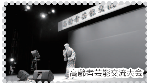
高齢者芸能交流大会