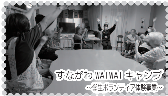
すながわ WAIWAI キャンプ ～学生ボランティア体験事業～